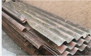
Plaque en fibro amiantée

Morceaux supérieurs à une feuille A4 (21 cm x 29 cm)