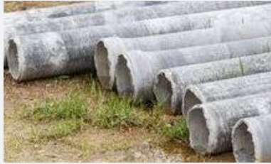
Canalisation en fibro amiantée