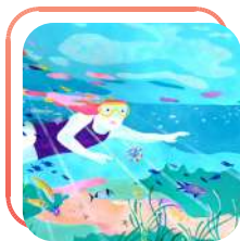
Illustration / Emmanuelle Houssais